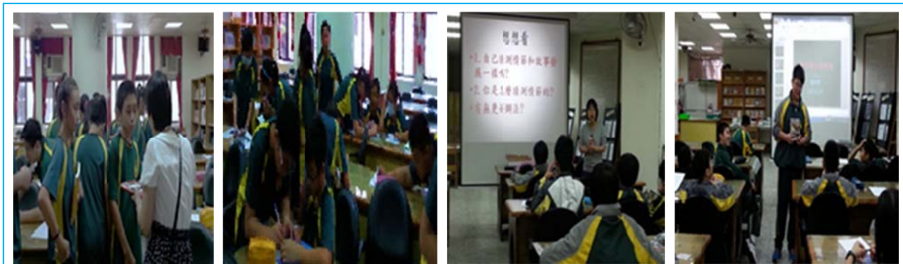
圖 5 我的圖書寫作課實施：師生討論、同儕討論、策略教學、孩子說書

2.主題閱讀展視野，自由閱讀提興趣：我以自編投影片設計主題閱讀，例如動物主角、科普讀物的閱讀，指導孩子思索文本線索；紐伯瑞獎青少年小說推薦，用閱讀搭橋梁，透過師生討論，帶孩子詮釋文本，找尋自己的人生定位；以多元方式(連結生活議題的導讀、少年