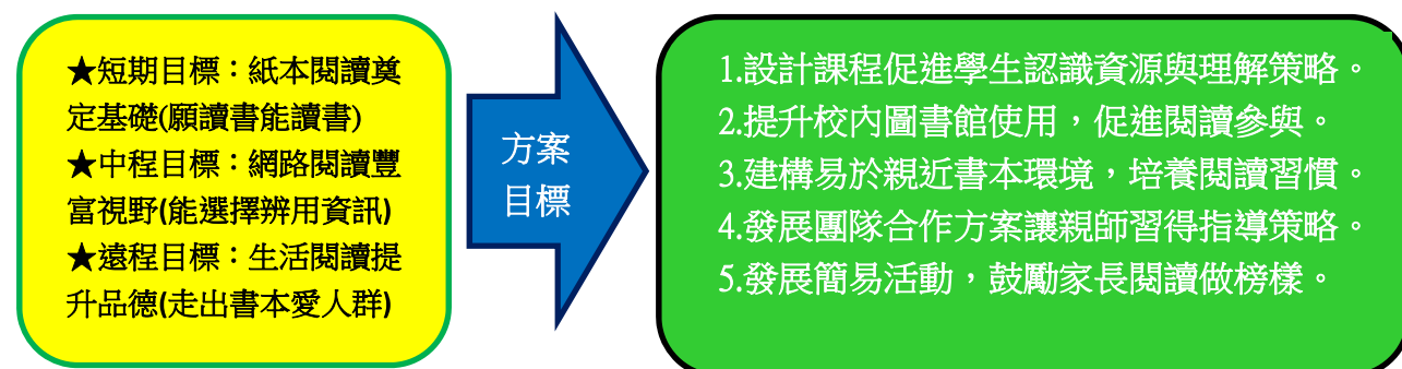
圖 2 百福國中閱讀推動目標