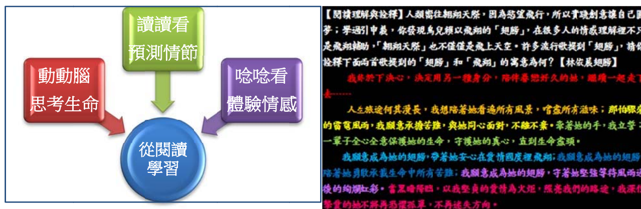
圖 4 閱讀寫作教學設計舉隅

國文領域融入閱讀教學部分，101 年起我已從範文精熟閱讀與課外閱讀提問設計著手，指導學生思考，繪製文本架構圖，練習策略，每週進行一節閱讀寫作課。圖 4 是 102 年閱讀課程設計舉例。右方是九年級閱讀理解詮釋範例。孩子閱讀雷驤「欲望飛行」，聆聽流行歌曲，分析翅膀和飛翔在不同文本的情感意涵。我以林依晨歌曲「翅膀」示例，以男主角的愛情誓言詮釋歌詞。文本形式黑色為底，寓意兩人戀愛前人生是黑色；內文彩色，象徵主角在愛情裡比翼飛翔，人生變彩色。左方是小說課教學設計，學生動腦、朗讀和默讀從閱讀學習。