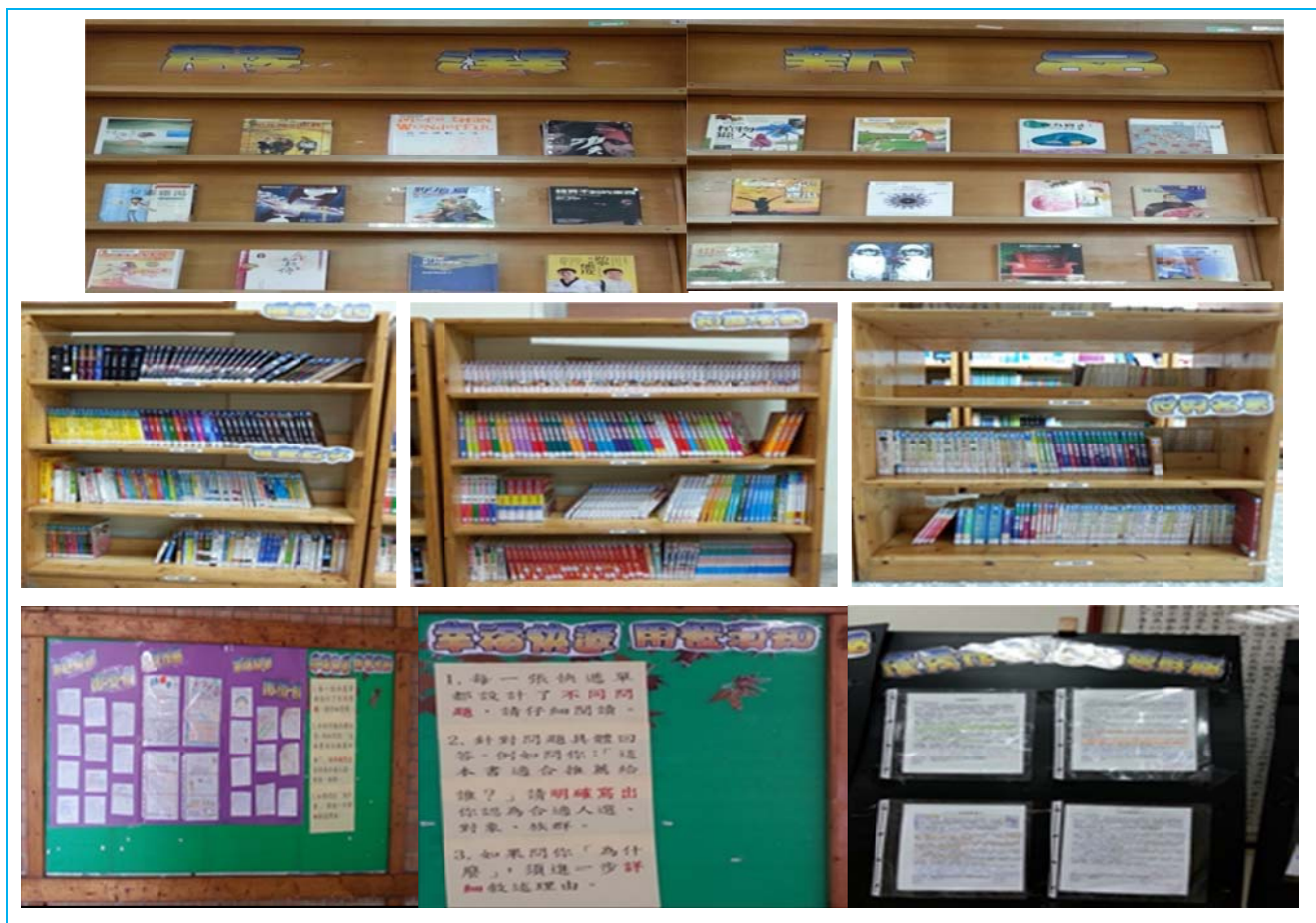
圖 6 圖書館 102 學年開始的新規劃：雜誌櫃改造、主題書櫃、教學看板

附錄 1 是百福悅讀吧點餐單設計。校內閱讀時間包括：週四晨讀 20 分鐘自由閱讀，隔週班會課 10 分鐘週報導讀，社團課 45 分鐘自由閱讀(七八年級 30 位學生自由參加)，閱讀寫作課 45 分鐘(15 分鐘閱讀)；並請孩子善用課餘時間。讀物以校內圖書館藏為主，孩子可借圖書，可自攜讀物。我更與體育老師合作爭取到美力閱讀 103 圖書。我設計的獎勵措施，承蒙校長支持募款，激勵導師創意，經營閱讀。獎勵金上限為 3000 元，用以增置班級閱讀資源，例如