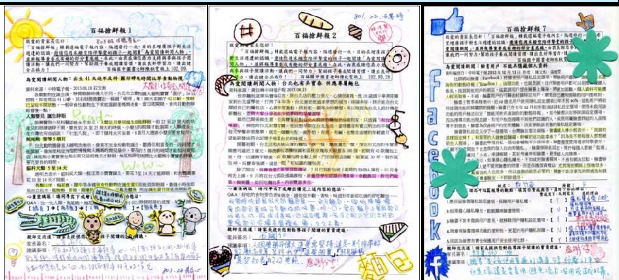
圖 9 百福搶鮮報優秀作品舉隅

您最常使用何種策略協助孩子課外閱讀？(請打勾✓複選) 陪孩子上圖書館 帶孩子逛書店 陪孩子看課外書 和孩子讀百福搶鮮報 陪孩子看雜誌 其他，請分享於下：___ 您最期待孩子從課外閱讀學到什麼？(排列順序寫出 1234) 更多知識 良好人生價值觀 待人接物的良好態度 涵養氣質 其他，請分享於下：