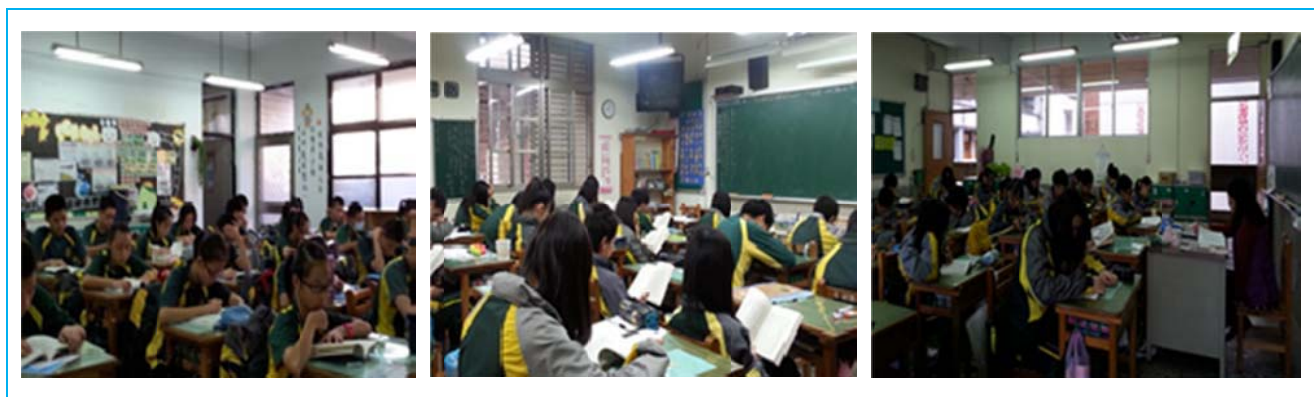
圖 7 百福國中晨讀實施景況

週四 8:00 到 8:20，請師生課外閱讀；我們鼓勵導師一起閱讀。段考當週與前一週暫停。