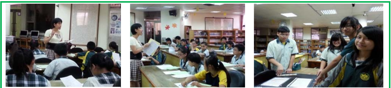
圖 12 圖書股長幹部訓練與學生志工服務學習

我借重孩子興趣挑選主題櫃架的讀物。選擇權，是提升孩子閱讀勝任感和興趣的重要因子。青少年圖書館必須有多元策略滿足興趣和學習。孩子推薦讀物，是參與圖書館經營的第一步。102 年 9 月進行幹部訓練與學生服務學習訓練，學生志工增設主題書櫃與學習資源。行政團隊溝通部分，我於 9 月 5 日協調舉行行政會議，決議由行政團隊了解並紀錄班級晨讀。