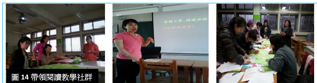
圖 14 帶領閱讀教學社群