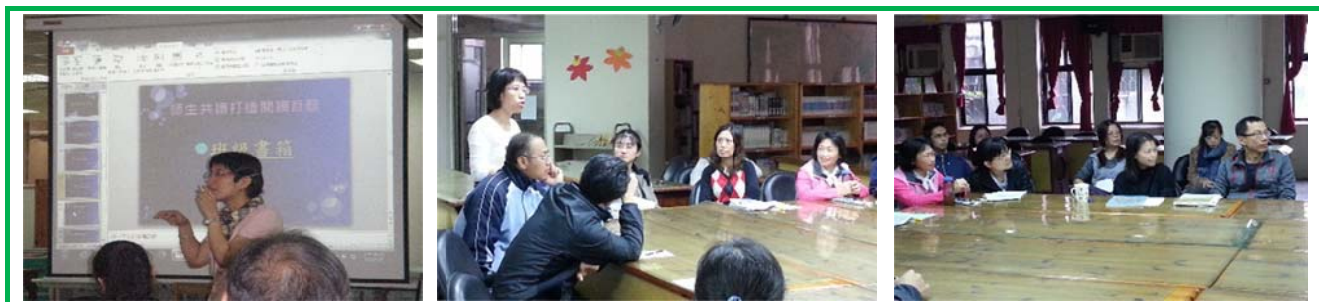
圖 13 我主持導師團隊會議