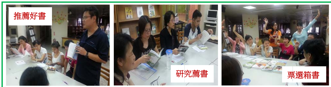
圖 10 102 學年度班級書箱會議

班級書箱一套 35 本，由熱心閱讀推動老師經營有成，共 84 套。過去書箱使用，僅流通於少數老師與班級；我於 101 年使用班級書箱帶領閱讀寫作，將主題閱讀課程經驗於領域會議分享給國文老師。102 年，我和全校老師推廣書箱教學經驗，邀請老師參與班級書箱會議，設計班級書箱觀察使用紀錄單，鼓勵導師交流共讀經驗，彙整班級書箱教學手冊；並邀請所有教學領域老師於領域會議推薦好書，課堂教學導讀領域好書，增加師生親近好書的機會。