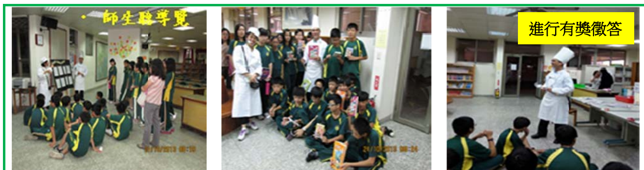
圖 11 圖書館導覽：校長和我都穿著廚師服作導覽

5 號餐圖書館導覽： 取名為「主廚上菜秀」，由校長和我策劃，介紹圖書館閱讀資源，增加入館意願。活動目標對象設定七年級學生，他們對圖書館較陌生，教室離圖書館最遠。